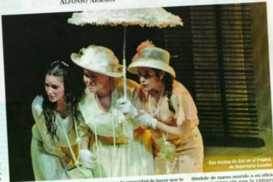
Una escena de Ana en el trópico , de Repertorio Español